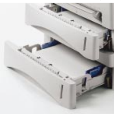
Optionale 2. Papierkassette für 500 Blatt Gesamtkapazität

Das Brother MFC-9870 ist ein zuverlässiger Laserdrucker, ausgestattet mit PCL4-Emulation und per optionalem PrintServer auch im Team einsetzbar. 600 x 600 dpi bringen exzellente Ergebnisse aufs Papier – und das mit 12 Seiten pro Minute. So werden auch größere Druckjobs rasant erledigt. Die 250-Blatt-Papierkassette, die mit einer optionalen 2. Papierkassette erweitert werden kann, erspart häufiges Nachfüllen. Mit USB (Universal Serial Bus) und paralleler Schnittstelle (IEEE1284) findet das MFC-9870 problemlos Anschluss unter Windows (3.1/95/98/NT4.0) und an die neue Apple Macintosh Generation.